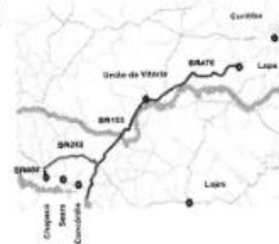
Mapa provisório de novas concessões de rodovias.

Trechos: Eixo PR 428 (Lapa) Div. SC/RS; Eixo BR 153 Eixo-BR 480. Eixo: BR 282 - Chapecó Extensão Total: 463,1 km Prazo: 30 anos Produção e exportação de proteínas