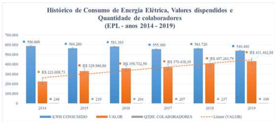
Gráf. 1. Evolução do consumo de energia elétrica e gastos com fornecimento na EPL.

3.1.3. Com a finalidade de se obter um panorama sobre a evolução do consumo e dos gastos com o fornecimento de energia elétrica na EPL, em comparação com a força de trabalho existente (profissionais, terceirizados e estagiários), levantou-se dados nos processos de pagamento da CEB-DIS, para o período de 2014 a 2019, conforme gráfico 1 abaixo: